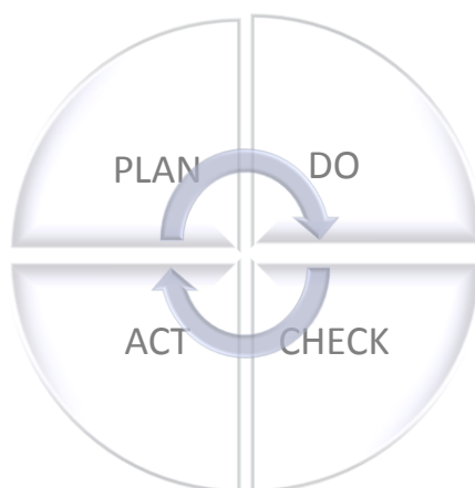
Figure 1: roue de la qualité

Pour que ce que l'Association Activitalité propose à ses membres reste au top niveau, nous nous basons sur le principe de la roue de la qualité, illustré dans le schéma ci-dessous.